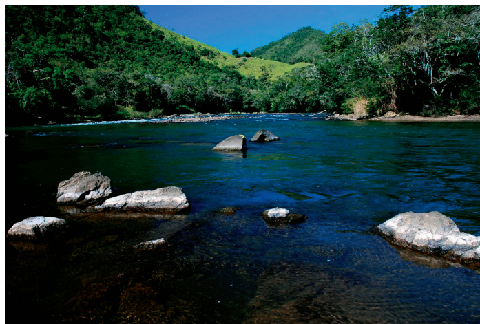
Raul S. Telles do Valle/ISA

• Embelezam o ambiente e mantêm a paisagem.