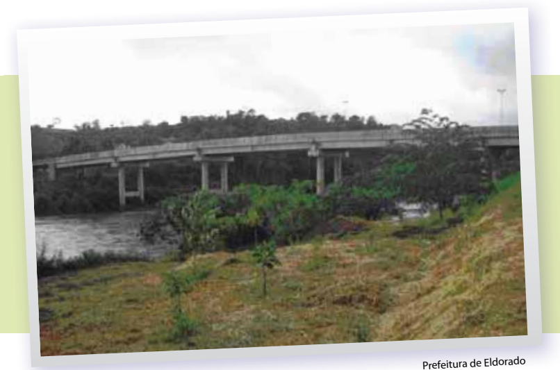
Prefeitura de Eldorado