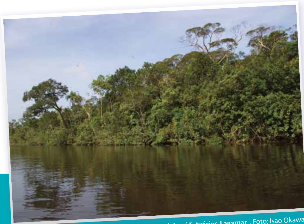
Rio Cordeiro / Estuários Lagamar . Foto: Isao Okawa

Qual a importância dos projetos de reflorestamento e como recuperar as matas ciliares.