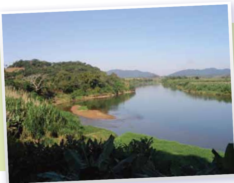
Rio Ribeira de Iguape/Registro - Arcplan

As matas ciliares são formações florestais que ocorrem ao longo dos rios, córregos ou no entorno de lagos, várzeas e reservatórios. Protegidas pelo Código Florestal, as florestas ciliares são essenciais para o escoamento das águas das chuvas, estabilização das margens e barrancos evitando o assoreamento dos rios, interação entre os ecossistemas terrestre e aquático (temperatura da água, alimentação da fauna aquática e terrestre). As matas ainda desem-